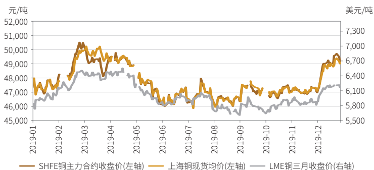
上海铜期货、铜现货及LME铜期货价格比较

2019年，上海铜期货价格与国内现货价格保持高度一致，相关系数为0.98，价格联动高度紧密。经过多年稳健发展，上期所铜期货价格作为国内现货市场的基准定价的地位日益巩固。上海铜期货价格与国际铜价走势一致，与LME连续价格相关度为0.91，国际市场和国内市场价格相互引导。