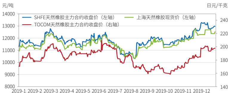
2019年上海天然橡胶期货、天然橡胶现货及东京工业品交易所橡胶期货价格比较

多年来，上期所天然橡胶期货与境外橡胶期货价格相关性高，与现货价格相关性高，有效发挥了价格发现功能。2019年，上海期货交易所天然橡胶期货价格与国内现货价格相关系数为0.94，价格联动性高；与东京商品交易所3号烟胶片期货价格相关系数为0.44。经过多年的稳健发展，上海期货交易所天然橡胶期货价格已成为国内现货市场定价的主要参考基准。