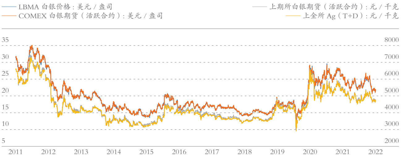
图 3：2012-2022 年上期所白银期货与现货和境外市场价格相关性

上期所白银期货上市以来，与 COMEX 白银期货和 LBMA 白银现货价格均保持高相关性（图 3）。2021 年上期所白银期货主力合约价格与 LBMA 白银现货价格相关系数为 0.9686，与上金所白银 T+D 价格相关系数为 0.9955，与 COMEX 白银期货主力合约价格相关系数为 0.9575。期现价格和境内外价格的高度相关有利于企业提升套保效率，抵御市场价格风险。